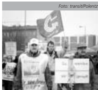
Immer wieder Proteste