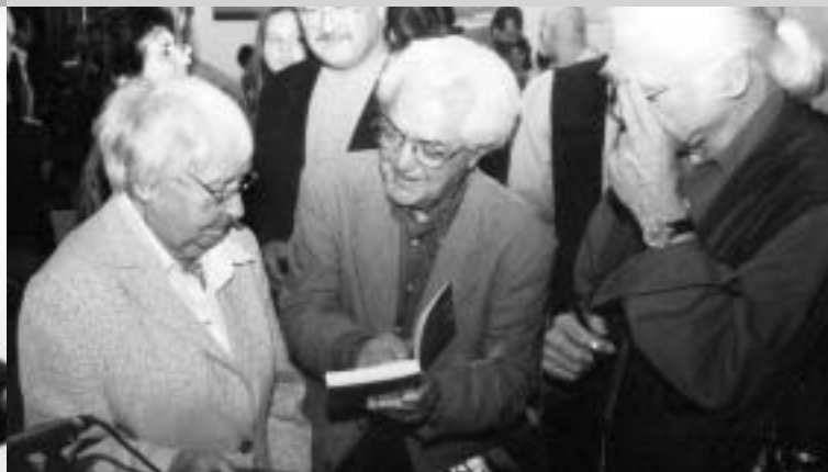
Interessiert: Dreiunddreißig mal zehn Minuten