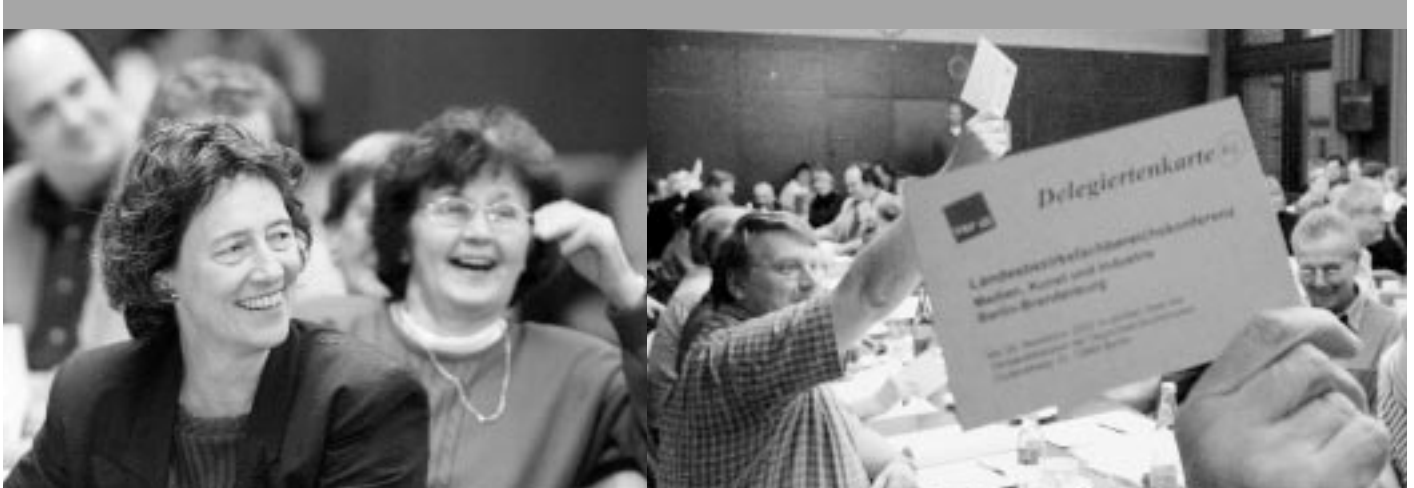
Die Delegierten hatten ein gerütteltes Pensum abuarbeiten. Das forderte Konzentration, aber manchmal half auch ein Lachen...